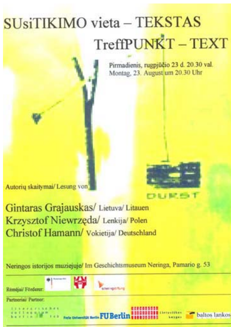
Poster für die öffentliche Lesung in Nida